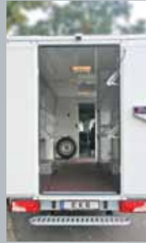
Bequemer Durchgang zum Fahrerhaus