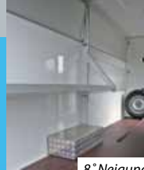
8° Neigung der Regale